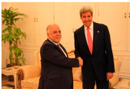
ケリー米務長官はイラクのアバディ新首相と会談＝9月10日、バグダッド Secretary Kerry Meets With Iraqi Prime Minister al-Abadi U.S. Secretary of State John Kerry meets with Iraqi Prime Minister Haidar al-Abadi in Baghdad, Iraq on September 10, 2014. [State Department photo/ Public Domain]

米オバマ前大統領はムスリム同胞団を非暴力的(民主的)社会運動とみなし、イスラム型民主主義国家への移行を担う勢力として期待したのであった。しかし「イラク・シリアのイスラム国」の誕生に直面し戦略の見直しを余儀なくされた。ヤジューディ教徒救出のための 5 日連続の空爆はそのきっかけとなった。