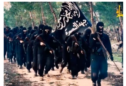
ヌスラ戦線 Al-Nusra Front

In March, 2011, the Arab Spring movement spread to Syria, giving rise to local anti-government movement. The Assad regime responded by severely suppressing it. As the tribal anti-government forces and the internationally-supported National Coalition for Syrian Revolutionary and Opposition Forces failed to achieve unity, global jihad militants affiliated with Al Qaeda continued entering Syria from various Arab states. The Islamic State of Iraq took advantage of this situation, and dispatched one of its key Syrian members, al-Golani to Syria in August, 2011 to establish IS foothold there.