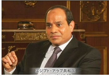
2014年5月26-28選挙で大統領に当選したエジプトのシシ大統領 (エジプト第二革命) Egyptian President El-Sisi who was elected in the election held on May 26-28, 2014 (Second Egyptian revolution)

2010年末チュニジアで始まったアラブの春はチュニジア、エジプト、リビアの長期独裁政権を倒し、イスラム型の民主主義国家へと移行するのではないかという期待を抱かせた。しかし期待に叛し国家は弱体化し、権力の空白が生じ、混乱ばかりが拡大し、内乱・内戦状況に至った。かろうじてその状況を克服しなんとか政情を安定させることができた国はチュニジアとエジプトであったが、リビアは未だに政権を担い得る政府の誕生に至っておらず分裂国家の様相を呈したままだ。