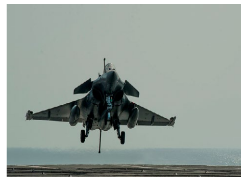
フランスは2015年9月27日、シリアで初の空爆を行い東部のIS訓練キャンプを破壊したと発表した。写真は爆撃を行った同型の仏戦闘機ラファール France announced that it carried out first aerial bombardment in Syria and destroyed ISIS training camps in eastern Syria on September 27, 2015. The photo shows the same type of French fighter jet Rafale

Turkey initially limited its participation to al-