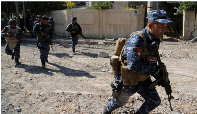
2017年3月6日、モスル西部地区を進軍するイラク治安部隊。翌7日、同治安部隊はISから主要政府庁舎ビルを奪還した (VOAニュース) Iraqi security forces advance during fighting against Islamic State militants, in western Mosul, Iraq, March 6, 2017. Iraq's military said Tuesday (March 7) its forces recaptured control of the main government buildings in western Mosul from Islamic State militants (VOA News)

2014年6月29日、イスラム過激組織ISISが「イスラム国」樹立をインターネット上に宣言してから今年で丸3年を迎えようとしている。現状から視れば「イラク・シリアのイスラム国」は既に崩壊していると見做すことができる。しかしイラクの第2の都市モスル西側にある根拠地とシリアの都市ラッカの根拠地は未だ陥落に至っていない。両根拠地を死守せんとするISは「人間の盾」作戦を展開している。民間人の犠牲を少なくするために陥落までの時間は要するであろうが、陥落に向かってのカウントダウンに入ったことは間違いない。