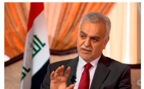
CNNのインタビューに答えるハシミ副大統領：米国防務省はイラクのハシミ副大統領に逮捕状が発行されたことに懸念を示し、状況を注視するとした。イラク駐留米軍の撤退は18日に完了している。ハシミ副大統領は宗派対立の再燃を警告、マリキ首相への批判強める。(2012.01.31 Tue posted at: 09:19 JST)

The Islamic State of Iraq rapidly expanded its controlled territories, seizing Falujah located 60 kilometers from Baghdad in January, 2014 and seizing Mosul, the second largest city in Iraq. By that time, the territory effec-