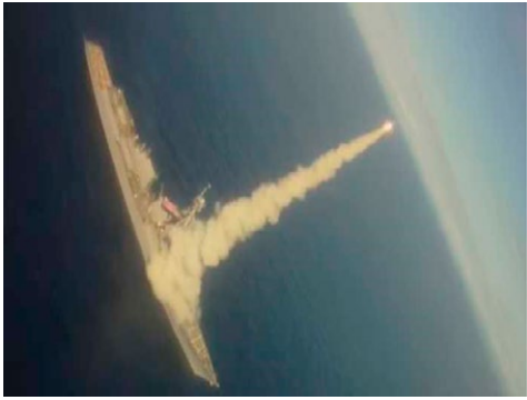
2014年9月23日、紅海やペルシャ湾に展開したミサイル駆逐艦アーレイ・バークからトマホークを発射して口火を切った。使用したトマホークは計47発 The US forces started military action by launching 47 Tomahawk cruise missiles from the Arleigh Burke-class missile destroyers deployed in the Red Sea and the Persian Gulf on September 23, 2014

2014年9月から、米オバマ前大統領は「ISを解体し、壊滅させる」として欧州を歴訪し、ケリー国務長官は湾岸諸国を根回し支持を取り付けた。その上で9月22日、シリアに対する空爆を実行した。米軍とアラブ合同軍が共同でシ