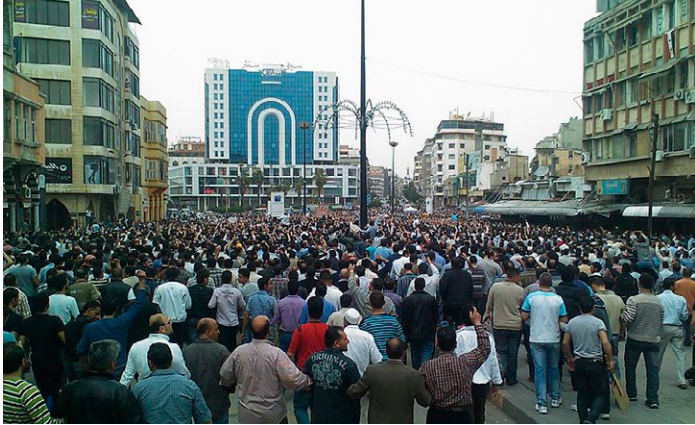
シリアのホムスで 2011 年 4 月 18 日起きた大規模な反アサドデモ (ウィキメディア) Very large demonstration in Homs, Syria against Al Assad regime in the Syrian Uprising (Wikimedia Commons) 18 April 2011

領域支配に戦略を定めた「イラク・イスラム国」は反米・反マリキ・反シーアを掲げ「アメリカの押しつけによる民主主義とそれに結託したシーア派マリキ政権は失敗した」と断じ、スンニ派の元バース党员、旧フセイン政権時代の幹部、情報機関、軍人、官僚を巻き込んでいったのである。