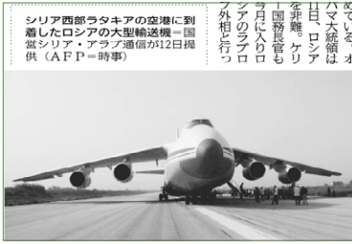
2015年9月12日、アサド政権支配のラタキア空軍基地にロシアの大型輸送機2機到着。 Two large Russian transport aircraft arrived at the Latakia Air Base controlled by the Assad regime on September 12, 2015.