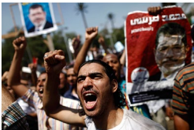
2013年7月6日、モルシ氏が政権の座を追われた後、エジプト各地でモルシ支持者と反対派が銃撃を含む衝突、数人が死亡、数十人が負傷した。

さらに間違ったメッセージは、イスラム過激派による武装闘争によって米軍をイラクから敗退させたのだというイメージを与えたことである。その印象はムジャーヒディーン闘争でソ連軍を敗退に導いた戦いの立役者ウサマ・ビン・ラーディンを英雄視した過去を彷彿とさせ、イラクとシリアのジハード戦士を英雄視することに結びついたのであった。したがってイラクの反米過激派を勢いづけただけでなく、アラブの春の運動全体が過激派に主導される流れとなったのである。