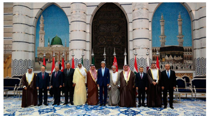
ケリー米務長官は湾岸協力会議・地域パートナー会合の参加者と記念写真－9月11日、サウジアラビアのジッダ U.S. Secretary of State John Kerry poses for a photo with Gulf Cooperation Council (GCC) and Regional Partners meeting participants in Jeddah, Saudi Arabia on September 11, 2014.

On the other hand, in Syria where civil war continued, the Assad regime was unlikely to follow demands from