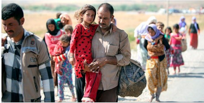
ISの攻撃からシリア側に逃れるヤジューディ教徒 (2014年8月14日付 The Huffington Post) Yazidis are fleeing from ISIS attack to Syria in August, 2014 (The Huffington Post)

そのような中、イラク北部シリアの国境に近いシンジャーのヤジューディ教徒（キリスト教）が山岳地帯に 5 万人が取り残され、ISIS に改宗を迫られ、拒否すれば全員殺害されるのではないかというニュースが流れた。オバマ前大統領は彼らを救うため空爆を実行した。